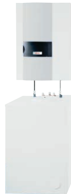
THISION® avec accumulateur en sous-œuvre

passives. Pour tenir compte de leurs faibles besoins énergétiques, la puissance du brûleur d'une THISION® 9 par exemple fonctionnera de manière modulante de 0,9 à 9,5 kW. Cela veut dire une proportion de modulation extraordinaire de 1 : 10. Autre avantage : THISION® convainc par ses émissions sonores particulièrement basses et peut être installée facilement partout grâce à son montage mural compact.